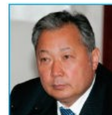
Курманбек Бакиев – президент страны